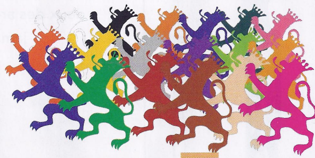
Le logo du club

aphteuse sévissant, le concours a été annulé par le préfet ! » Nombre d'archers bretons ont des souvenirs très prégnants de cette époque car, au fil des ans, les concours Nature et 3D vernois ont rassemblé beaucoup de monde, la convivialité était, il faut le dire, présente tout le long du concours et de son organisation !