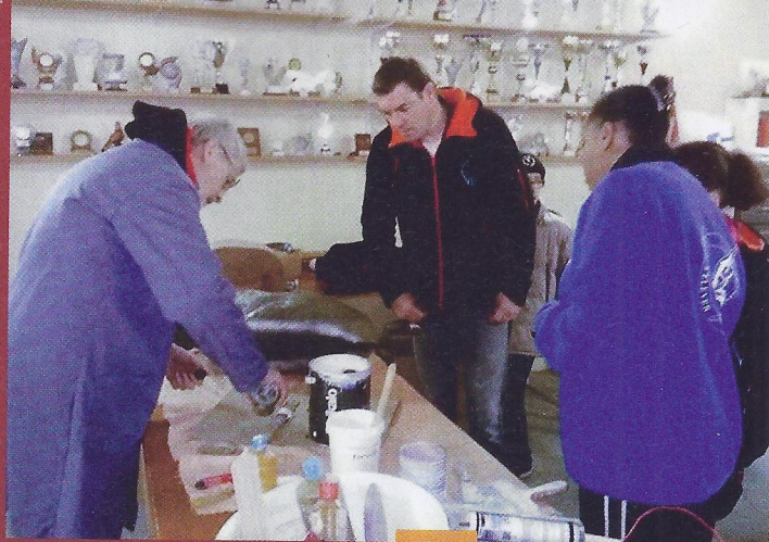
Des archers bricoleurs pour réparer les cibles

et un bâtiment loués par la mairie de Vern au Patis Fraux, centre de réadaptation.